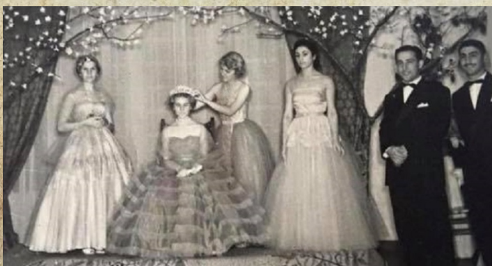
Evento realizado no Clube Sete de Setembro de Caçador, no salão dos espelhos. Coroação da rainha.