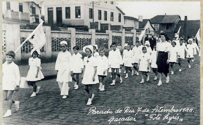
Desfile Cívico ano de 1944, Rua Prefeito Carlos Sperança. Colégio Nossa Senhora Aparecida. Em 07 de setembro de 1944.