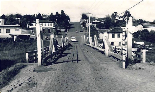
Ponte de acesso ao Hospital de Caridade e Maternidade Jonas Ramos.